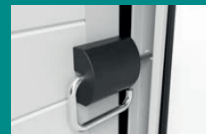
VERROU INTÉRIEUR CAPOTÉ